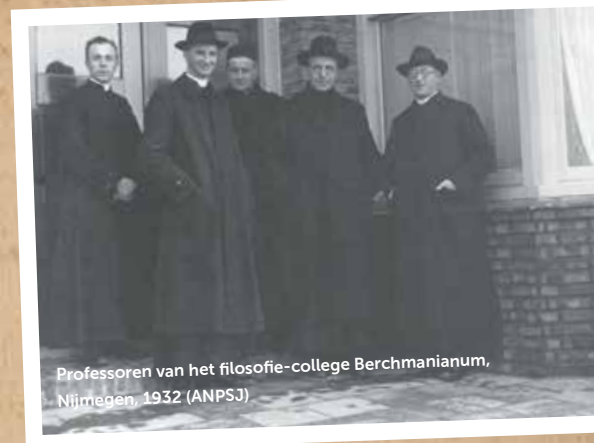
Professoren van het filosofie-college Berchmanianum, Nijmegen, 1932